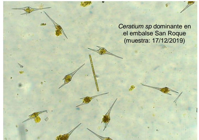
Ceratium sp dominante en el embalse San Roque (muestra: 17/12/2019)

La cota del lago es de 33,17 m, 2,13 m por debajo de vertedero. Se observa funcionamiento de los difusores en el sector de ingreso a garganta. No se observa apertura de válvulas.